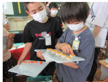
< 3年生 >