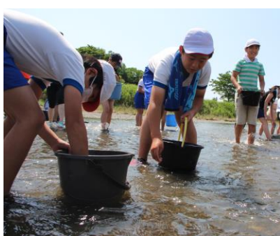
< 5年生 >