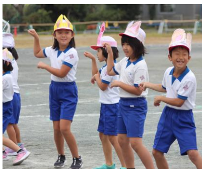
< 2年生 >