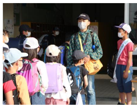
< 6年生 >