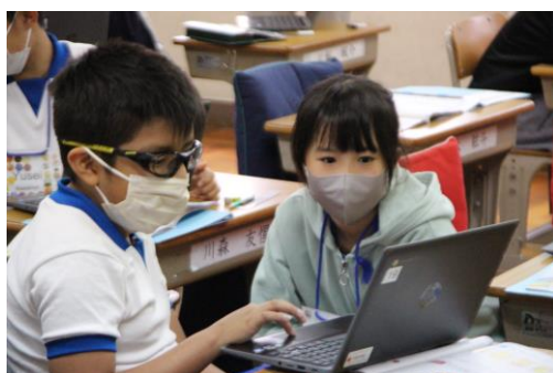
< 4年生 >