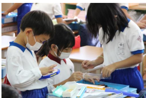
< 1年生 >

『笑顔いっぱい ありがとうでいっぱいの今井小』になるといいなと伝えた4月、今の今井小はどうでしょうか。先生は『笑顔いっぱい、ありがとうもいっぱいの今井小』になれたんじゃないかなと思います。そして、4月から今年以上の『笑顔とありがとうの今井小』を目指していけるといいなと思います。1年間、本当にみんな頑張りました。これで先生のお話を終わります。